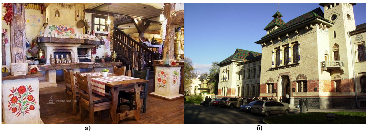
Рис. 5. Ієрархічні рівні синтезу мистецтв та використання традиційних будівельних матеріалів: а) інтер'єр ресторану української кухні в Києві; б) Полтавський краєзнавчий музей

В той же час високий розвиток науково-технічного прогресу та впровадження нанотехнологій в подальшому відкривають широкі естетичні та художньо-образні можливості застосування, поряд із традиційними, інноваційних виробів і матеріалів (бетон та залізобетон; скло та інші матеріали і вироби з мінеральних розплавів; полімерні матеріали) для створення неординарних середовищних композицій та реалізації сміливих творчих етнодизайнерських задумів.