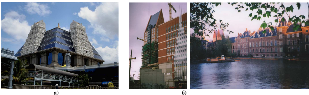
Рис. 3. Композиційно-просторовий рівень прояву національної ідентичності: а) буддійський храм в Дели; б) гармонійне включення нової висотної будівлі в історичний силует Гааги

Середовищна композиція поточного просторові комбінації, встановлює художньо-образні засоби етнодизайну, такі як кольорова гама, пропорції, акценти і нюанси та інші, що мають стати основою вже до предметного наповнення середовища від обладнання до витворів декоративно-прикладного мистецтва, обумовленого як народними традиціями, так і перспективними технологіями, що зроблять об'єкти дизайну більш комфортними та сучасними (рис. 3).