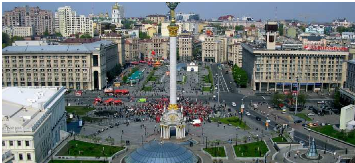
Рис. 1. Містобудівний ієрархічний рівень прояву національної ідентичності. Сучасна забудова та благоустрій Майдану Незалежності в Києві з ознаками української та глобальної ідентичності

Наступним ієрархічним рівнем є урбаністично-просторова організація, яка в конкретних параметрах втілена у відкритих і закритих міських просторах, їх плануванні, площах, висотах, конфігураціях тощо. Це втілення є містобудівним структурним блоком, який визначає місце і роль середовищного об'єкту у просторі поселення та його забудови з урахуванням різних природно-кліматичних та місто-будівних умов розташування об'єкту дизайну, характеристиками оточуючого його природного і штучного середовища (рис. 1, рис. 2).