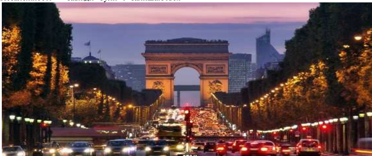
Рис. 2. Містобудівний ієрархічний рівень прояву національної ідентичності. Новий район Дефанс, увязаний віссю з відомою Триумфальною аркою в Парижі

Корисно також навести хрестоматійний приклад забудови нового району Дефанс з знаменитою аркою, що зв'язаний однією містобудівною віссю з не менш знаменитою історичною Триумфальною аркою в Парижі (рис. 2).