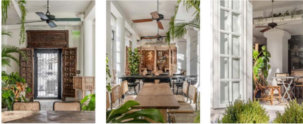
Рис. 5. Інтер'єр ресторану «Тайський привіт» Київ, Україна, 2019 [10]