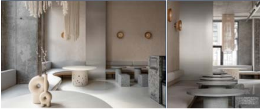
Рис. 1. Інтер'єр ресторану «Їстетика» з поєднання сучасного та етнічного дизайну Київ, Україна, 2021 [11; 12]