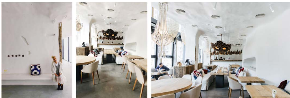
Рис. 4. Інтер'єр ресторану «ШО». Київ, Україна, 2018.