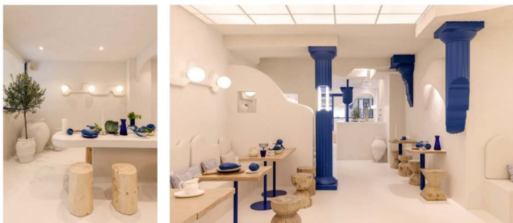
Рис. 8. Інтер'єр ресторану «Егео» Валенсія, Іспанія, 2022 [9]