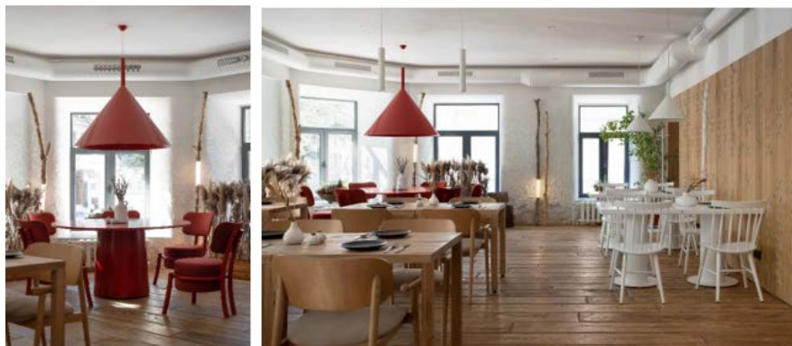
Рис. 2. Інтер'єр ресторану «100 років тому вперед» Київ, Україна, 2019 [10]