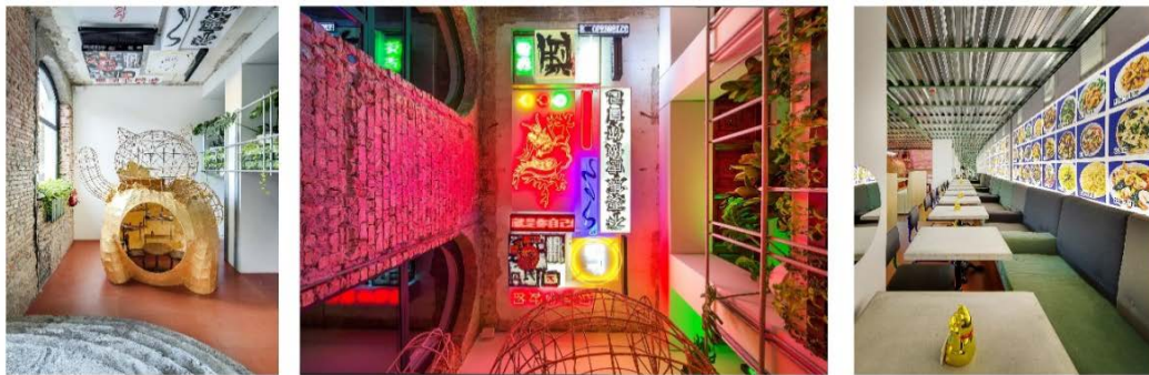
Рис. 6. Інтер'єр ресторану «Китайський привіт» Київ, Україна, 2016 [10]