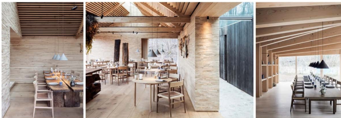
Рис. 7. Інтер'єр ресторану «Noma» Копенгаген, Данія, 2018 [8]