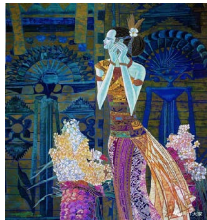
Іл. 6. Дін Шаогуан «Рясний врожай», 1994 р. Олія, 180×160 см. Місце зберігання: зібрання Художнього музею Юньнана, Китай