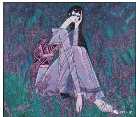
Іл. 4. Дін Шаогуан «Фіолетовий сад», 1988 р. Олія, 100×100 см. Місце зберігання: приватна колекція, Китай