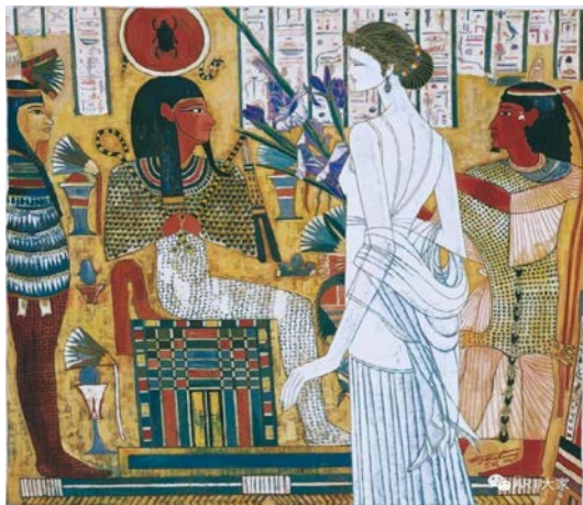
Іл. 9. Дін Шаогуан «Слава єгипетського мистецтва», 1993 р. Олія, 150×134 см. Місце зберігання: приватна колекція