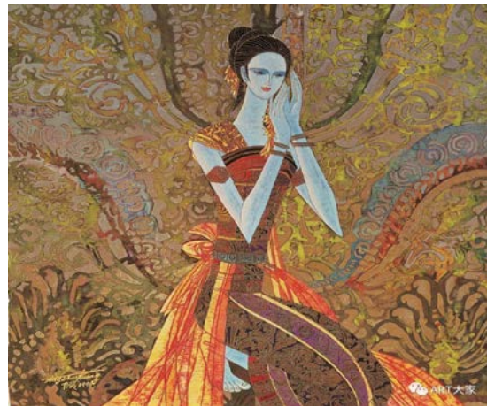
Іл. 10. Дін Шаогуан «Благословення», 1994 р. Олія, 41,5×40,5 см. Місце зберігання: зібрання Національного художнього музею Китаю, Пекін, Китай