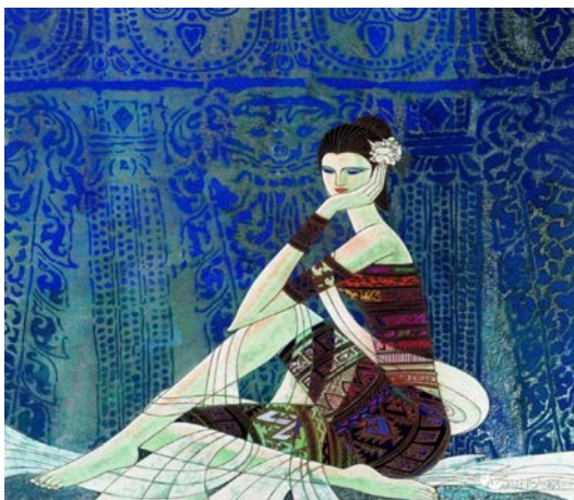
Іл. 11. Дін Шаогуан «Мирна мить», 1995 р. Олія, 160×160 см. Місце зберігання: приватна колекція