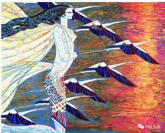
Іл. 3. Дін Шаогуан «Град і сонячне світло», 1990 р. Олія, 150×130 см. Місце зберігання: зібрання Національного художнього музею Китаю, Пекін, Китай