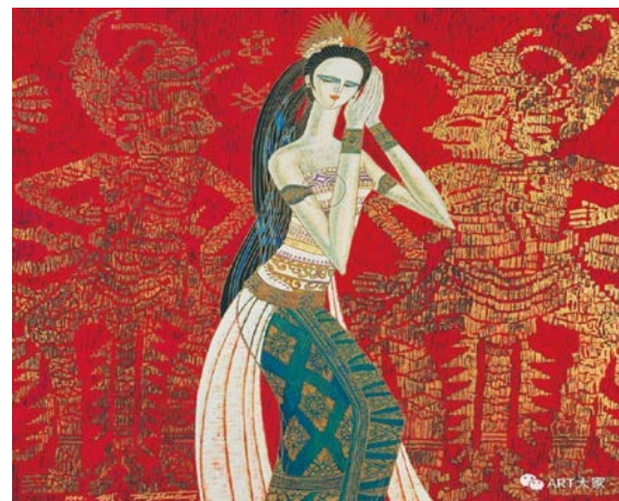
Іл. 12. Дін Шаогуан «Давня легенда», 1990 р. Олія, 90×90 см. Місце зберігання: приватна колекція