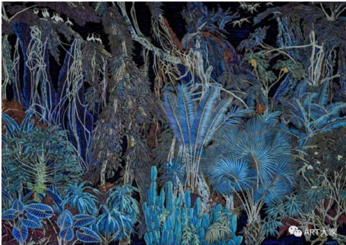
Іл. 7. Дін Шаогуан «Бесконечне життя», 2020 р. Олія, 190×250 см. Місце зберігання: зібрання Національного художнього музею Китаю, Пекін, Китай