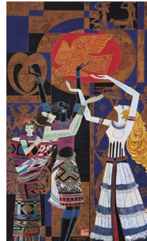
Іл. 8. Дін Шаогуан «Світ, рівність, прогрес», 1994 р. Олія, 250×130 см. Місце зберігання: зібрання Художнього музею Юньнаня, Китай