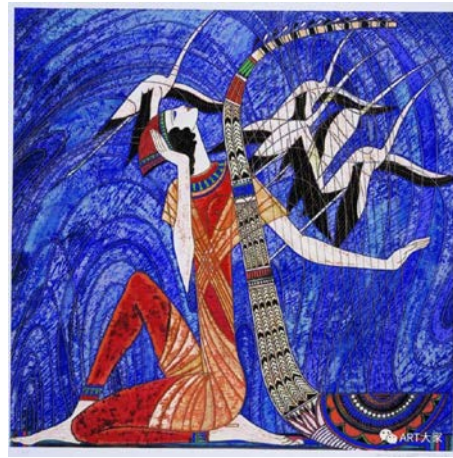
Іл. 2. Дін Шаогуан «Пісня свободи», 1991 р. Олія, 83,5×83,5 см. Місце зберігання: невідоме