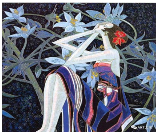
Іл. 5. Дін Шаогуан «Мрія», 1993 р. Олія, 80×80 см. Місце зберігання: зібрання Художнього музею Сішунбаньна, Китай