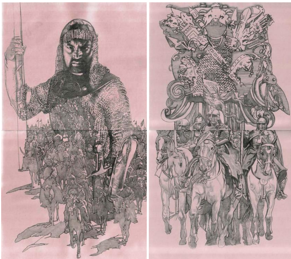
Іл. 3. Ілюстративне оформлення сторінки 16 видання роману в віршах «Берестечко» Ліни Костенко до рядків: «І хан як вилитий із воску».