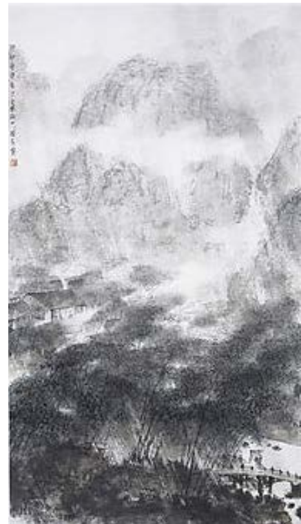
Іл. 16. Фу Баоші «Бамбуковий гай під дощем». Папір, кольорова туш, 110,2 x 62,7см, 1944, Нанкінський музей