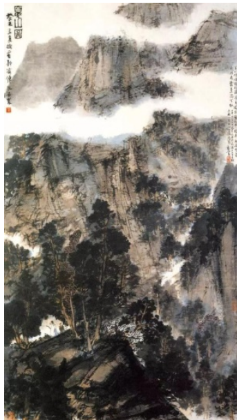
Іл. 3. Фу Баоші, «Літні гори». Папір, кольорова туш, 111 x 62,5 см, 1943, Палацовий музей у Забороненому місті (Пекін)