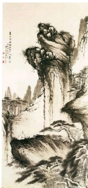
Іл. 9. Мей Цин (1623–1697) «Високі гори і поточні води». Папір, туш, 249,5×121см, 1694, Палацовий музей у Забороненому місті (Пекін)