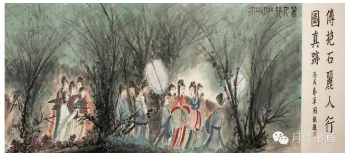
Іл. 7. Фу Баоші «Жінки, що йдуть». Папір, кольорова туш, 65x560см, 1944