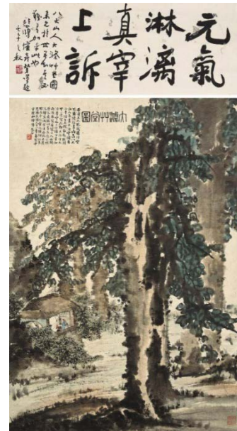
Іл. 5. Фу Баоші. «Даді Цаотан». Папір, кольорова туш, 85,0 x 58,1см, 1942, Палацовий музей у Забороненому місті (Пекін)