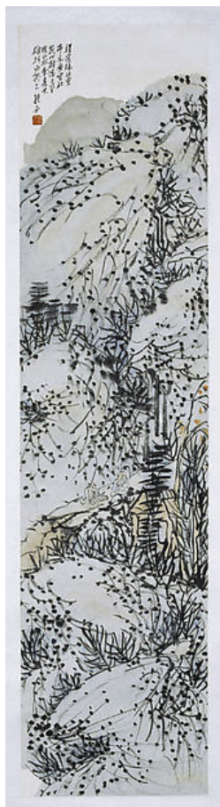
Іл. 11. Фу Баоші «Соснові скелі, що п'ють разом». Папір, кольорова туш, 133,6×32,2см, 1925. Нанкінський Музей