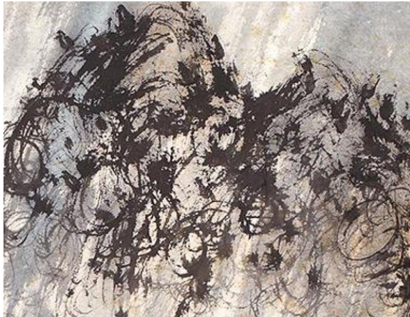
Іл. 1. Характерний зразок техніки «Баоші Цунь»

картини і вивчав доробок класика китайського мистецтва Ши Тао (іл. 8).