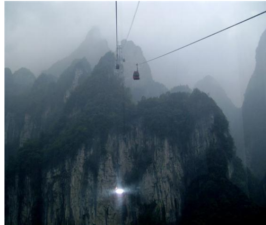
Іл. 2. Гори та ландшафти Чунцина. Сучасне фото