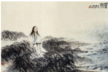
Іл. 6. Фу Баоші. «Цюй Юань». Папір, кольорова туш, 58x84см, 1942, Нанкінський Музей