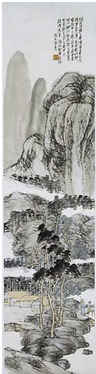
Іл. 14. Фу Баоші «Чоловік з милицею та арфою». Папір, кольорова туш, 133,6x32,2см, 1925, Нанкінський музей

властивості, які допомагають досягнути враження, подібного до техніки «мокрого малювання» в акварелі.