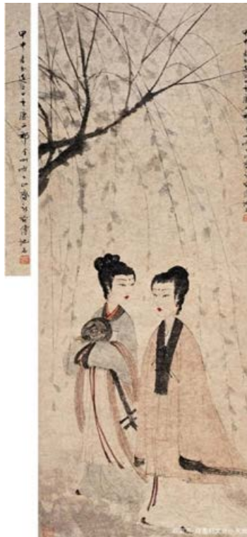
Іл. 15. Фу Баоші «Леді Сян». Папір, кольорова туш, 1944