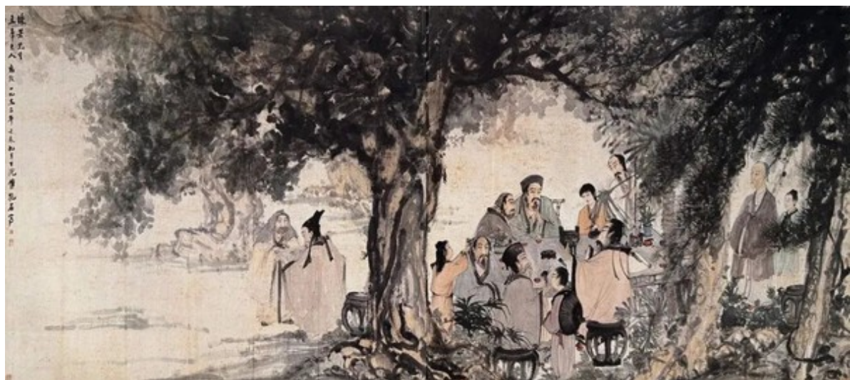
Іл. 17. Фу Баоші «Дев'ять старих». 1952, Меморіальний музей Го Моруо

Картини створені за цим методом, і серед них твір «Бамбуковий гай під дощем», характеризуються ритмікою смуг квасцевої