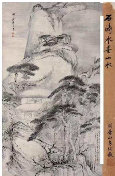
Іл. 8. Ши Тао (1642–1708), «Читання під сосною». 193×97см, папір, туш