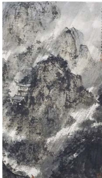
Іл. 4. Фу Баоші «Стрімкий сутінковий дощ». Папір, кольорова туш, 103,5 x 59,4 см, 1945, Нанкінський Музей