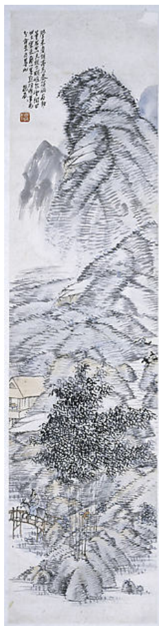
Іл. 12. Фу Баоші «їхати на віслюку під бамбуковим деревом». Папір, кольорова туш, 133,6 x 32,2см, 1925, Нанкінський музей