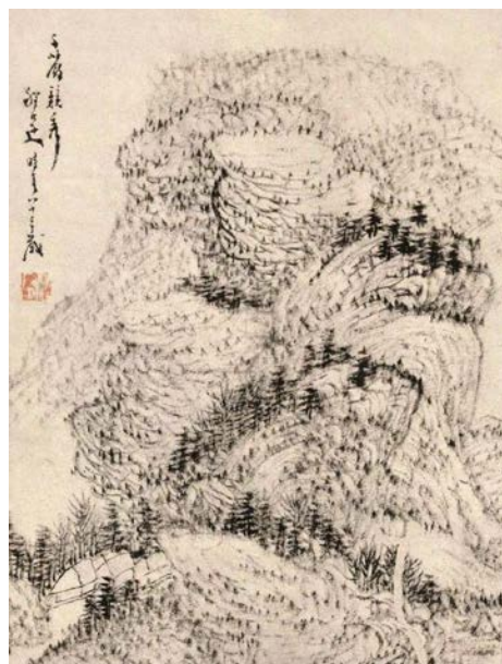
Іл. 10. Чен Суй (1607–1692). «Гори». Папір, туш 29,5× 22,7см, Музей провінції Чжецзян