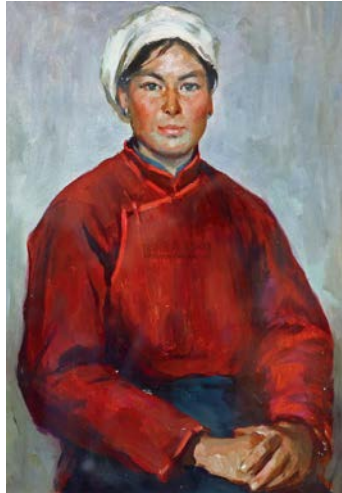
Іл. 8. Цай Лян, «Жінки Хуей», 1977. Олія, розмір: невідомий.

Місце зберігання: приватна колекція, Китай