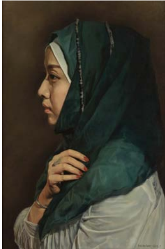
Іл. 7. Сюе Боюань, «Дівчина Хуей 1», 2015. Олія, 55x80см.