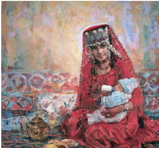
Іл. 1 Абдул Керім Насір ад-Дін, «Хамі Майсілайфу», 1984. Олія, 180×180 см. Місце зберігання: невідоме, Китай