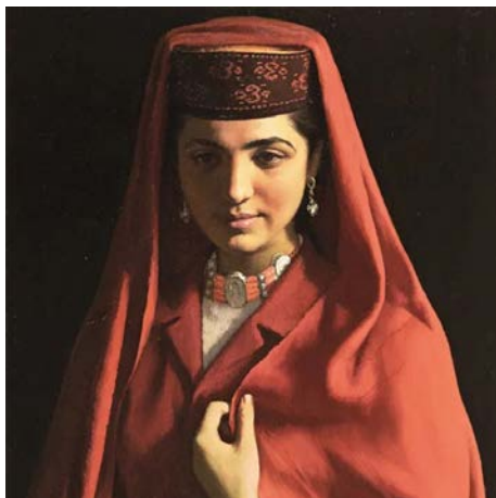
Іл. 3. Цзінь Шаньї, «Таджицька наречена», 1983. Олія, 50×60см. Місце зберігання: Національний художній музей, Китай