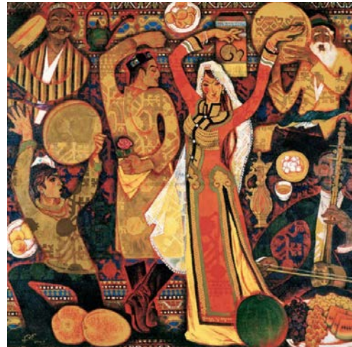
Іл. 2 Лю Бінцзян, «Материнське кохання», 2014. Олія, 100×100 см. Місце зберігання: невідомо, Китай