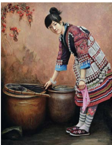
Іл. 5. Цун Жуйсюань, «Дівчина в сезоні квітів», 2014. Олія, 136х105см. Місце зберігання: приватна колекція. Китай