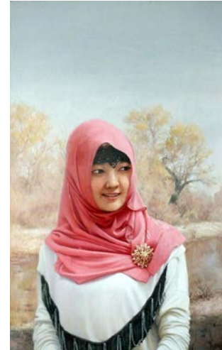
Іл. 9. Чень Баої, «Дівчина Хуей на березі річки Шуле», 2013. Олія, 50x80 см.

Місце зберігання: приватна колекція, Китай