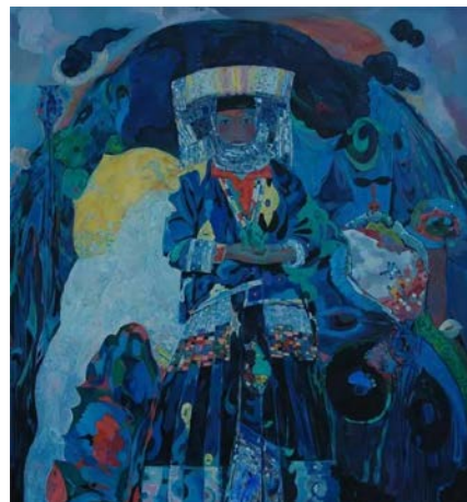
Іл. 4. Хуан Цзінь, «Гора», 2004. Олія, 150х140см. Місце зберігання: невідомо. Китай