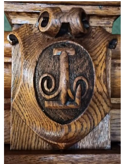
Рис. 2. Картуш з емблемою в центрі, з стовпця балюстради бібліотечної шафи головного корпусу НУЛП..