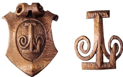
Рис. 3. Емблема на картуші та її збільшене зображення окремо від тла.