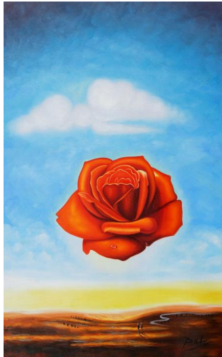
Рис. 1. С. Далі. «Медитативна троянда», 1958 (36 x 28, олія)