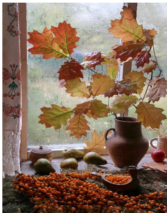
Рис. 6. Фотографія «Подих осені», автор В. Скляренко