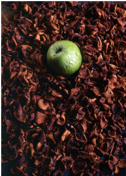
Рис. 9. Фотографія «Яблучні метамозози»