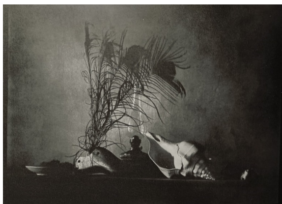
Рис. 3. Фотографія «Натюрморт в стилі Караваджо», автор Й. Судек