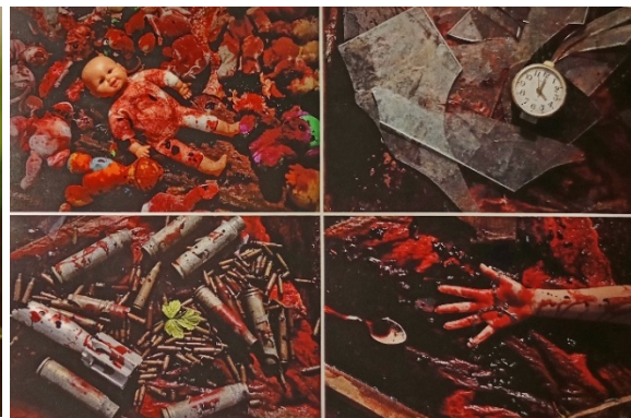
Рис. 12. Фотографія «Колір весни 2022», автор І. Жолобак