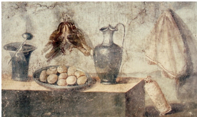
Рис. 1. Фреска з натюрмортом на стінах в Помпеї I-II ст. н. е.