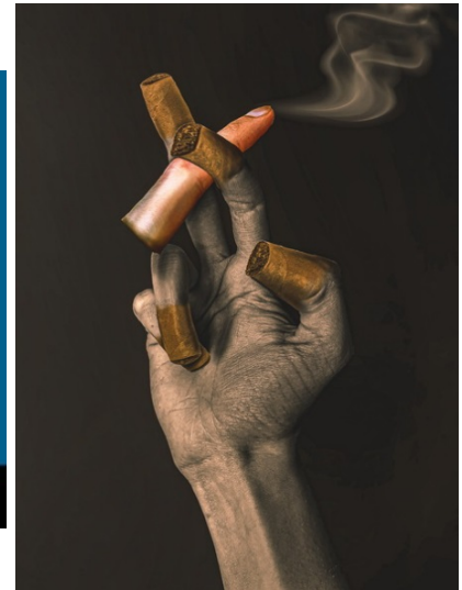
Рис. 8. Фотографія «Небезпечне задоволення», автор П. Квятковська