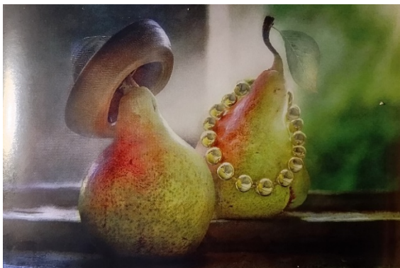
Рис. 11. Фотографія «Фламенко», автор А. Надєждіна