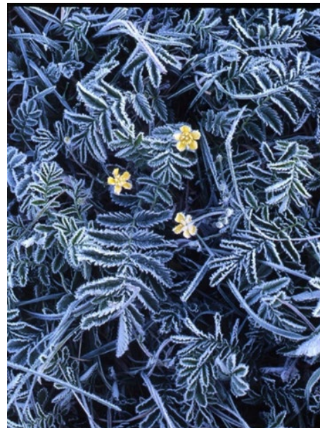
Рис. 10. Фотографія «Зимові визерунки», автор В. Скляренко