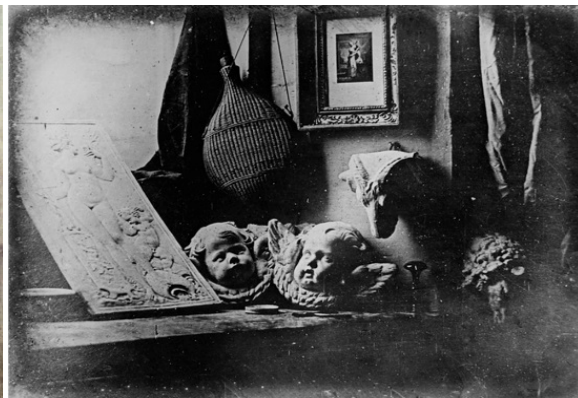
Рис. 2. Дагеротип «Натюрморт в майстерні» автор Л Дагер, 1837 р.