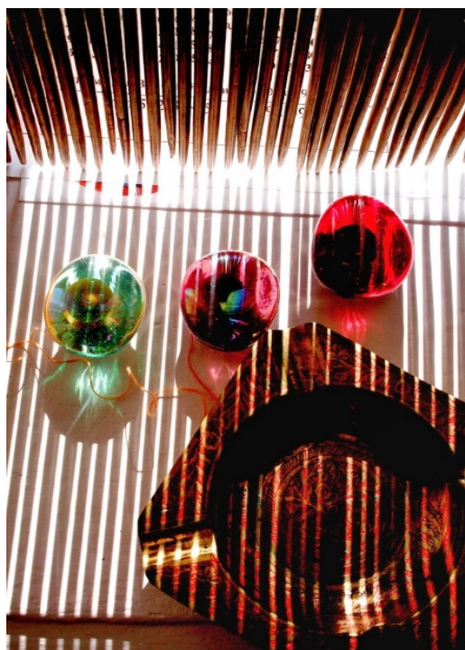
Рис. 5. Фотографія «Різноколірна гра», автор В. Скляренко