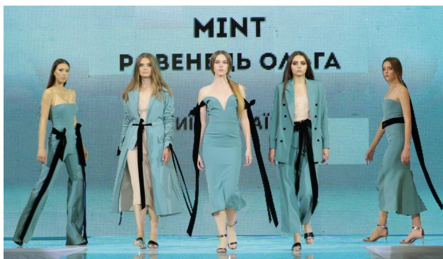
Рис. 3. Авторська колекція жіночого одягу «Mint» (автор Ровенець О.І.)