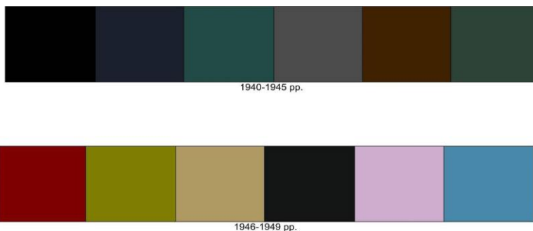
Рис. 2. Колірне рішення жіночого одягу 1940-1949 pp.