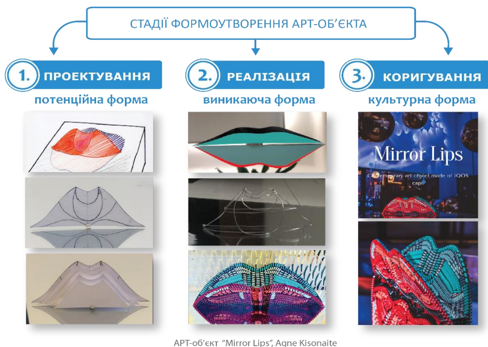
Рис. 2. Стадії формоутворення арт-об'єкта