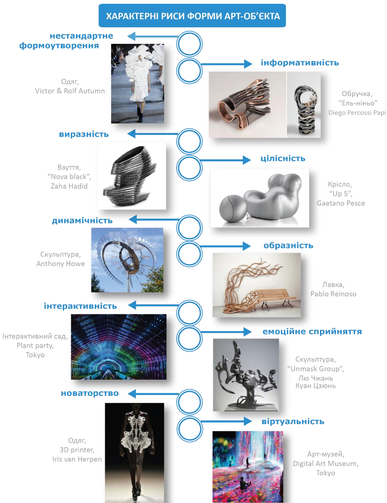
Рис. 3. Характерні риси форми арт-об'єкта