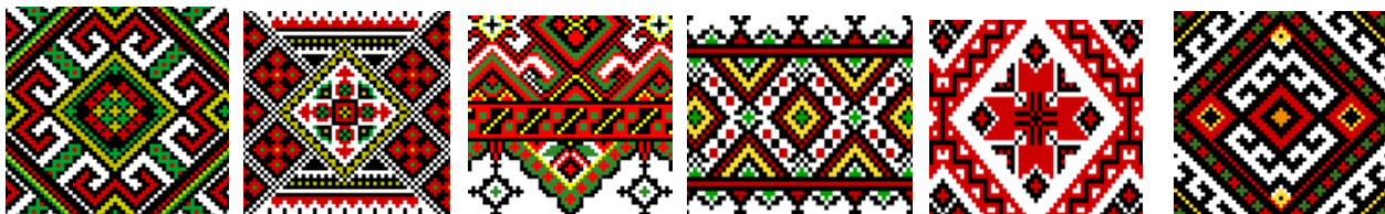
Рис. 2. Гуцульські вишивки, в яких рапорт створюється поєднанням кількох геометричних фігур

горизонтальному або вертикальному напрямках і складають квадрат, трикутник, коло, есовидна фігура, хрести, зубці, кучері, меандр та плетінка.