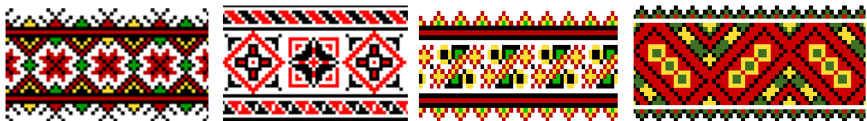
Рис. 1. Прості гуцульські вишивки

В основі гуцульської вишивки лежить геометричний орнамент, який складається із простих, ламаних, хвилястих, скісних, прямих та зубчастих ліній. Домінуючими у вишивці є квадрат, внутрішня площа якого заповнена хрестами, ромбами чи розетками. Зразки простих гуцульських вишивок візуалізовано на рис. 1.