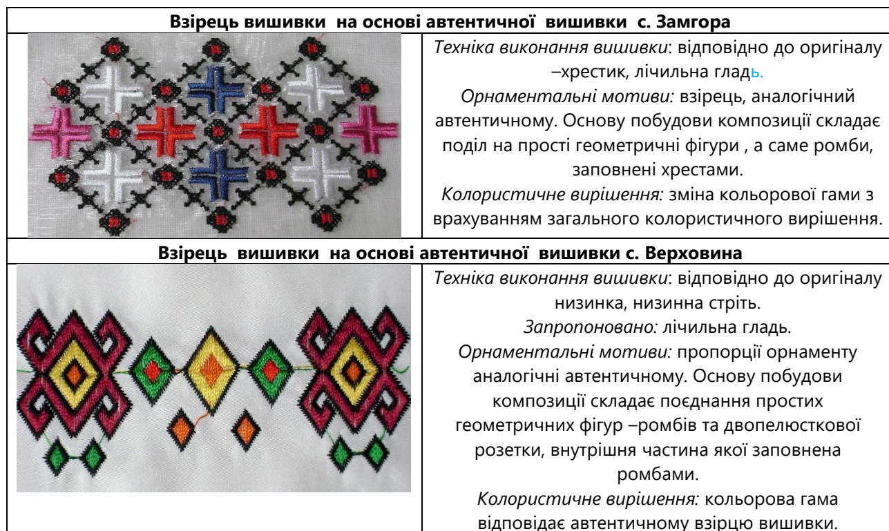
Таблиця 3. Приклади вишивок на основі автентичних зразків вишивки гуцульського одягу Івано-Франківщини