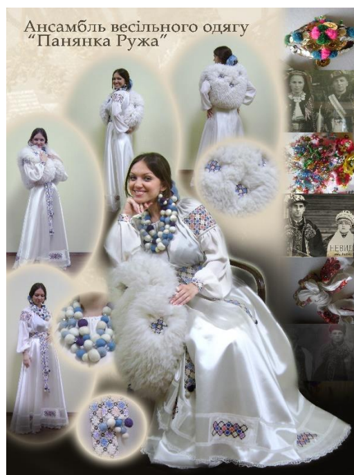
Рис. 5. Сучасний ансамбль весільного одягу «Панянка Ружа»

доречними. При відтворенні орнаменту, збереженими є техніки «хрестик» та «лічильна гладь». Здійснений пошук різних комбінацій кольорів спонукав до деякого помякшення загальної кольорової гами, що в поєднанні з конструктивними та орнаментальними рішеннями дозволило об'єднати їх загальним стилем та гармонією весільного вбрання, і створити цілісний образ саме весільного ансамблю «Панянка Ружа».