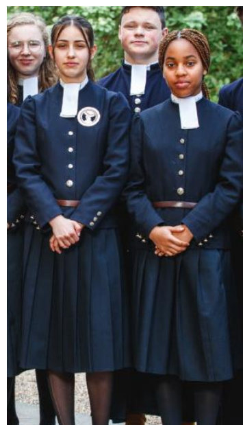
Рис. 12. Формені костюми учениць Christ's Hospital School зразка 1985 р. Архів Christ's Hospital School

В 1840-х рр. формений одяг учениць Maison d'éducation de la Légion d'honneur – це сукня, що відповідала напряму моди того часу – темно-синього кольору, Х-подібного