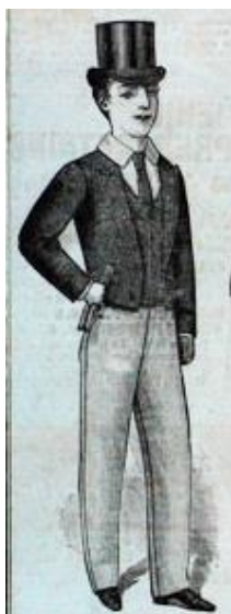
Рис. 1. Костюм учня молодших класів Eton College, м. Лондон, Англія, 1878 р., каталог Charles Baker and Co