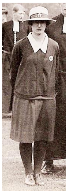
Рис. 10. Фрагмент фотографії учнів Christ's Hospital Shcool. Англія, 1929 р.