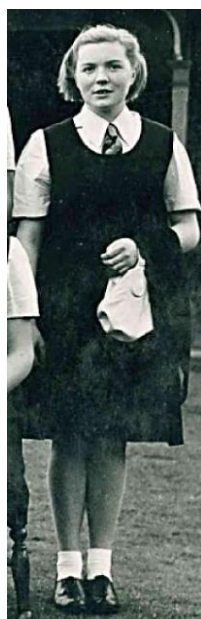
Рис. 11. Фрагмент фотографії учнів Christ's Hospital Shcool, 1948 р.