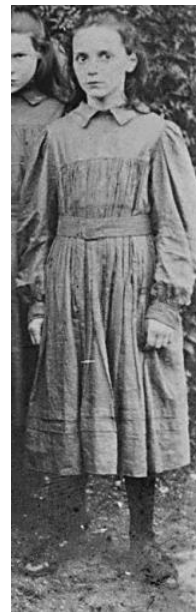
Рис. 9. Фрагмент фотографії учениць Christ's Hospital Shcool. м. Хетфорд, Англія, 1900 рр.