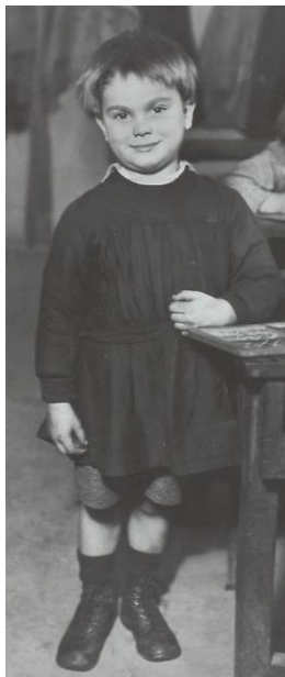
Рис. 8. «Мій друг Ернест». м. Париж., Франція, 1929 р.