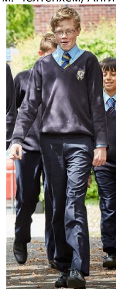
Рис. 6. Шкільний костюм учня Kennet School, 1990 – 2010 рр. Архів Kennet School м. Татчам, Англія

Краватка, ще один символ шкільного форменого костюму, що став широко використовуватись в шкільному одязі у 1920-х рр. (рис. 3) і продовжує залишатися в багатьох шкільних костюмах Англії і сьогодні.