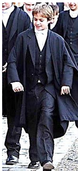
Рис. 2. Костюм учня Eton College, м. Лондон, Англія, 2000 рр.