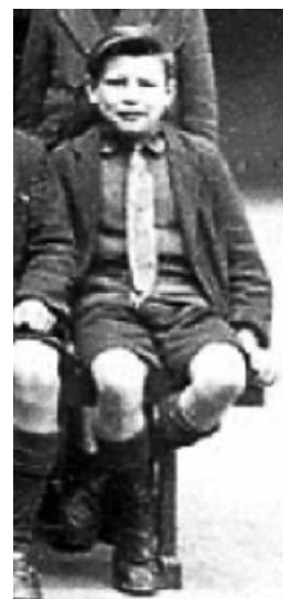
Рис. 3. Шкільний костюм Bellevue School, 1920 – 1930 рр.