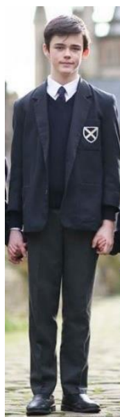
Рис. 5. Шкільний костюм учня Wells Cathedral School 1990 – 2010 рр.