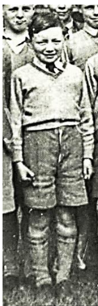
Рис. 4. Шкільний костюм Whinney B. P. School, 1950 р. Фрагмент фото з архіву Whinney Banks Primary School. м. Міддлсбро, Англія