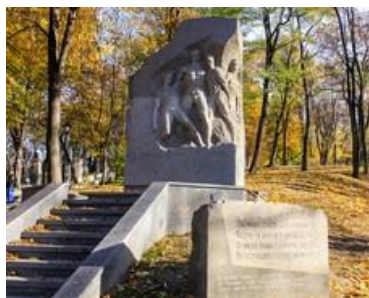
Рис. 3. Пам'ятник футболістам Київського «Динамо», загиблим в роки Другої світової війни. Скульптор Іван Горовий, м. Київ, 1971 р.