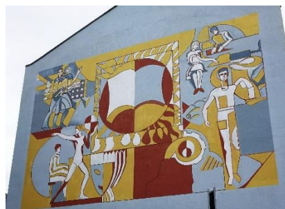
Рис. 4. Мурал «Спорт-ремейк». Автор Катерина Дядюк, м. Вінниця, 2019 р.