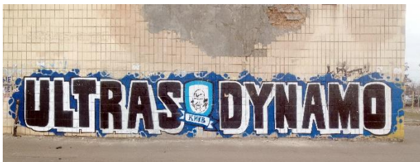
Рис. 12. Графіті ультрас спортклубу «Динамо», м. Київ

Окремим напрямом можуть бути графіті фанатів – уболівальників різних спортивних клубів. Спалах появи графіті на спортивну тематику у 2012 році через Чемпіонат Європи з футболу (UEFA EURO 2012) був закономірним. На рис. 12 [23] і рис. 13 [5] представлено графіті фанів двох різних спортивних клубів України: «Динамо» (Київ) і «Дніпро» (Дніпро).