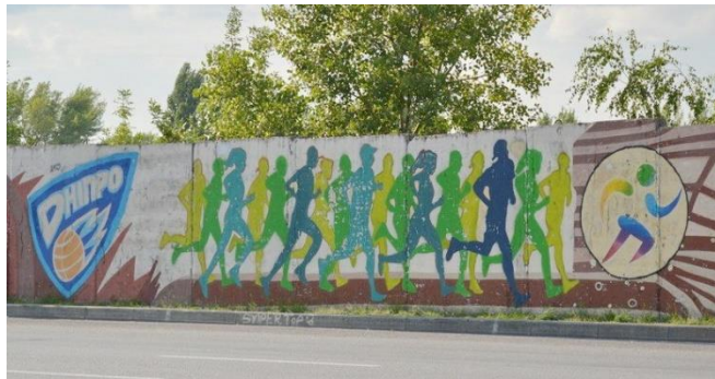
Рис. 14. Графіті реклами спорту, м. Дніпро