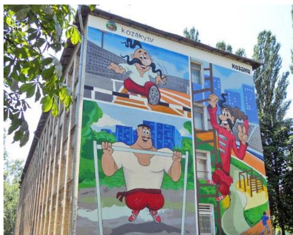
Рис. 9. Мурал "Козаки. Спорт" Стіна школи №131. Автор Віталій Гидеван, м. Київ, 2016 р.