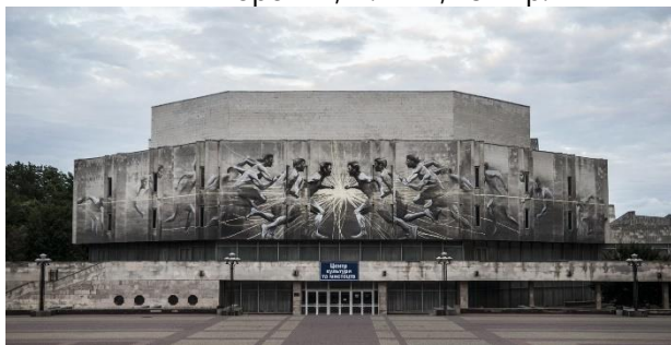
Рис. 5. Мурал, створений на фасаді Центру культури і мистецтв КПІ ім. Ігоря Сікорського. Автор Аарон Лі Хилл, м. Київ. 2016 р.