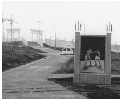
Рис. 1. Скульптура і панно в м. Каменському (Дніпродзержинськ), присвячені спорту (фото 1955 р.)