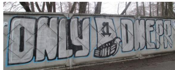
Рис. 13. Графіті ультрас спортклубу «Дніпро», м. Дніпро