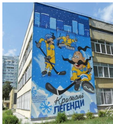
Рис. 10. Мурал "Козаки. Хоккей" стіна школи №223. Автори: Віталій и Богдан Гидеван, м. Київ, 2017 р.