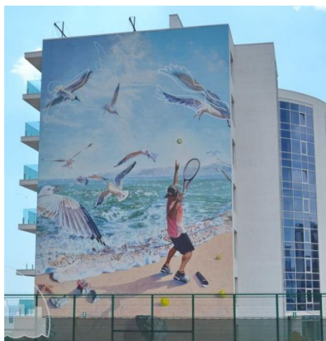
Рис. 7. Мурал «Спорт и море». Авторка Анастасія Білоус (англійка українського походження), м. Черноморск, 2018 р.