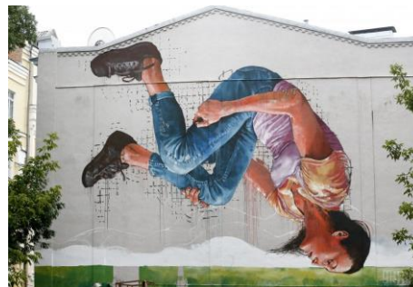
Рис. 6. Мурал, що відображає стрибок української спортсменки з художньої гімнастики, чемпіонки світу Анни Різатиної. Автор Мэґи Финтан, м. Київ, 2015 р.