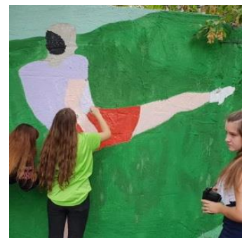
Рис. 15. Частина створеного мурала школи № 99 м. Києва і процес його створення дорослими і школярами