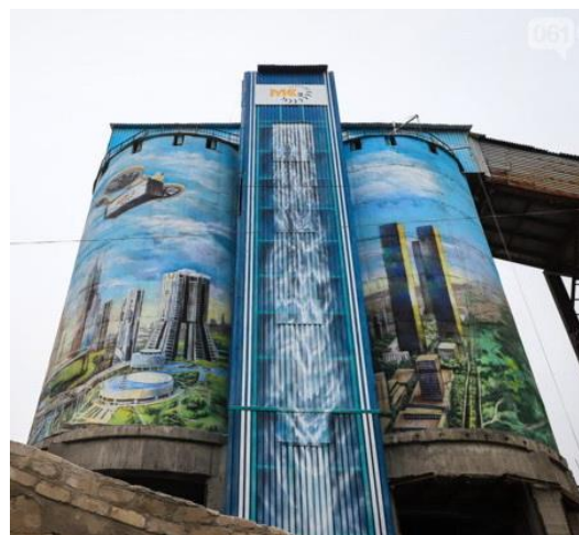
Рис. 8. Мурал «Місто майбутнього». Автори: Людмила Кирилук, Владислав Пучинський, Володимир Пастушка, м. Запоріжжя, 2019 р.