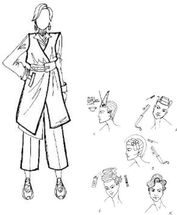
Рис. 2. Ескіз неформального образу, технологічна карта зачіски з репліками стилю М. Маск