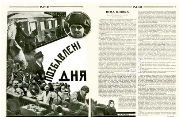
Рис. 9. Журнальна розгортка «Позбавлені дня». Ю. Кривдін. Журнал «КІНО», № 7 (19), 1927