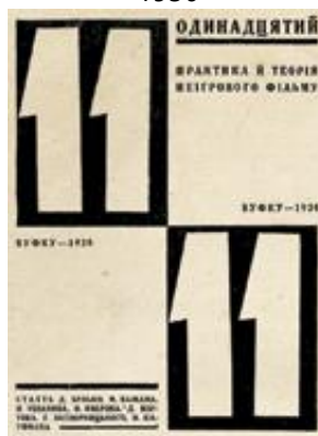
Рис. 16. Титульна сторінка видання «Одинадцятий». Ю. Кривдін. 1928