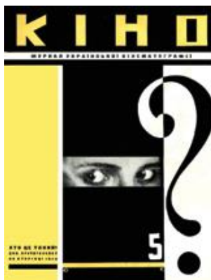
Рис. 12. Обкладинка видання «Кіно». Ю. Кривдін. 1928