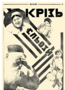
Рис. 10. Журнальна реклама-анонс «Кризь слюзи». Ю. Кривдін. Журнал «КІНО», № 1 (37), 1928