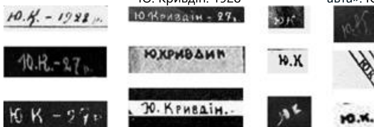
Рис. 18. Підписи Ю. Кривдіна у журнальних та книжкових виданнях. 1927–1931 рр.