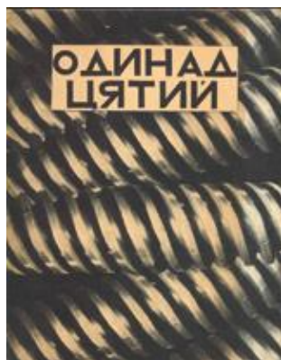
Рис. 15. Обкладинка видання «Одинадцятий». Ю. Кривдін. 1928