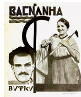
Рис. 11. Журнальна реклама-анонс «Василина». Ю. Кривдін. Журнал «КІНО», № 21/22 (33/34), 1927