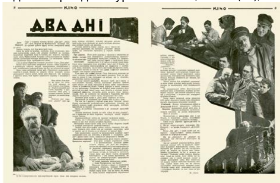
Рис. 8. Журнальна розгортка «Два дні». Ю. Кривдін. Журнал «КІНО», № 9 (21), 1927