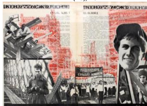
Рис. 6. Журнальна розгортка «Сталь, хліб і целулоїд». Ю. Кривдін. Журнал «КІНО», № 18 (30), 1927