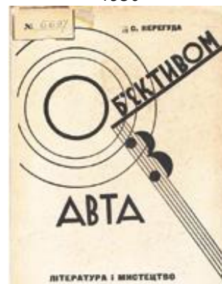
Рис. 17. Обкладинка книги Є. Перегуди «Об'єктивом з авта». Ю. Кривдін. 1931