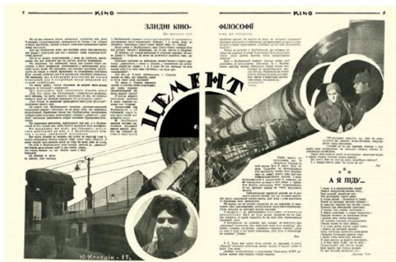
Рис. 1. Журнальна розгортка «Цемент». Ю. Кривдін. Журнал «КІНО», №12(24), 1927