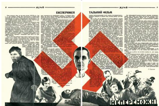
Рис. 5. Журнальна розгортка «Непереможні». Ю. Кривдін. Журнал «КІНО», № 17 (29), 1927