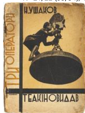
Рис. 14. Обкладинка видання «Три оператори». Ю. Кривдін. 1930