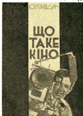
Рис. 13. Обкладинка видання «Що таке кіно». Ю. Кривдін. 1930