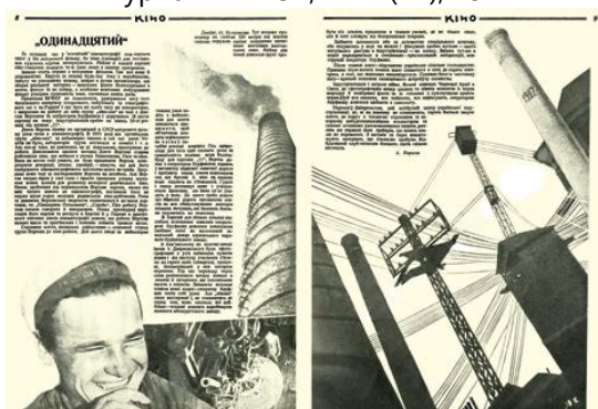
Рис. 3. Журнальна розгортка «Одинадцятий». Ю. Кривдін. Журнал «КІНО», № 21/22 (33/34), 1927