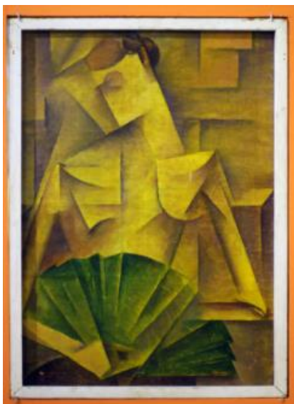
Рис. 3. Василь Єрмилов. Дама з віялом, 1919 р.