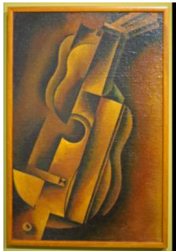
Рис. 2. Василь Єрмилов. Мандоліна, 1920-ті р.