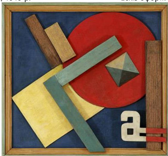
Рис. 5. В. Єрмилов, Рельєф А, 1920-ті рр.