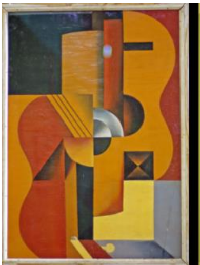
Рис. 1. Василь Єрмилов. Гітара, 1920-ті р.