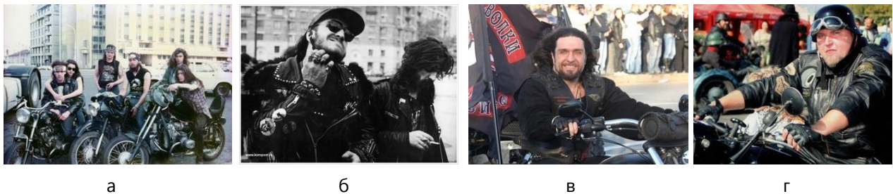
Рис. 4. Радянські рокери та пострадянські байкери: а – рокери, Росія, 1980 р.; б – байкери, Україна, 1992 р.; в – байкер, Росія, 2000 р.; г – байкер, Молдова, 2000 р.