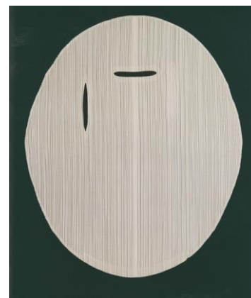
Рис. 9. Колекція «Складки, будь ласка», І. Міяке, 1993 [5]