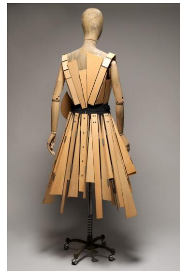
Рис. 12. Костюм з дерев'яних пластин, Й. Ямамото, 1991 [8]

Об'ємні, багат шарові композиційні форми, переважно ахроматичні в колекціях Йоджі Ямамото зміщують точку уваги з одягу на людину. Парадоксально, але ігноруючи людську фігуру, створюючи одяг, який деформує пропорції людського тіла, дизайнер привертає до нього ще більшу увагу, надаючи йому нових сенсів та трактувань [6]. Деконструювання класичних елементів, надання формам певної свободи свідчать про інтелектуалізацію одягу, про зв'язок внутрішнього та зовнішнього в кожному конкретному образі.