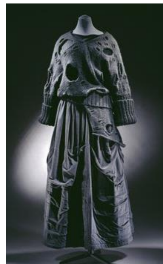
Рис. 6. Светр з дірками, Р. Кавакубо, 1982 [7]