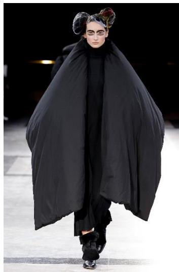
Рис. 11. Сукня, Й. Ямамото, 2014 [11]