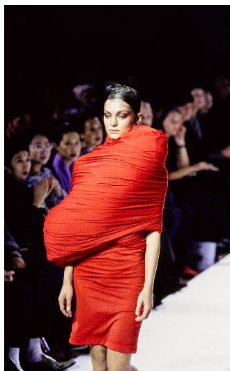
Рис. 5. Сукня, Р. Кавакубо, 1997 [13]