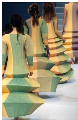
Рис. 8. Сукня «Мінарет», І. Міяке, 1995 [12]