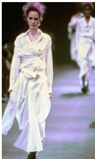
Рис. 4. Сукня, Р. Кавакубо, 1992 [13]