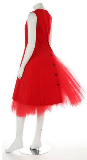
Рис. 2. Сукня, Р. Кавакубо, 1982 [13]