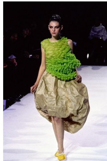
Рис. 3. Сукня, Р. Кавакубо, 1997 [13]