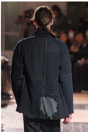
Рис. 10. Комплект одягу, Й. Ямамото, 2016 [11]

ношіння, тим самим сприяючи максимальній індивідуалізації образу носія одягу. Відсутність завершеності виробів перегукується з твердженням про безкінечність деконструкції, за яким, жоден з результатів не може бути кінцевим та істинним [15].