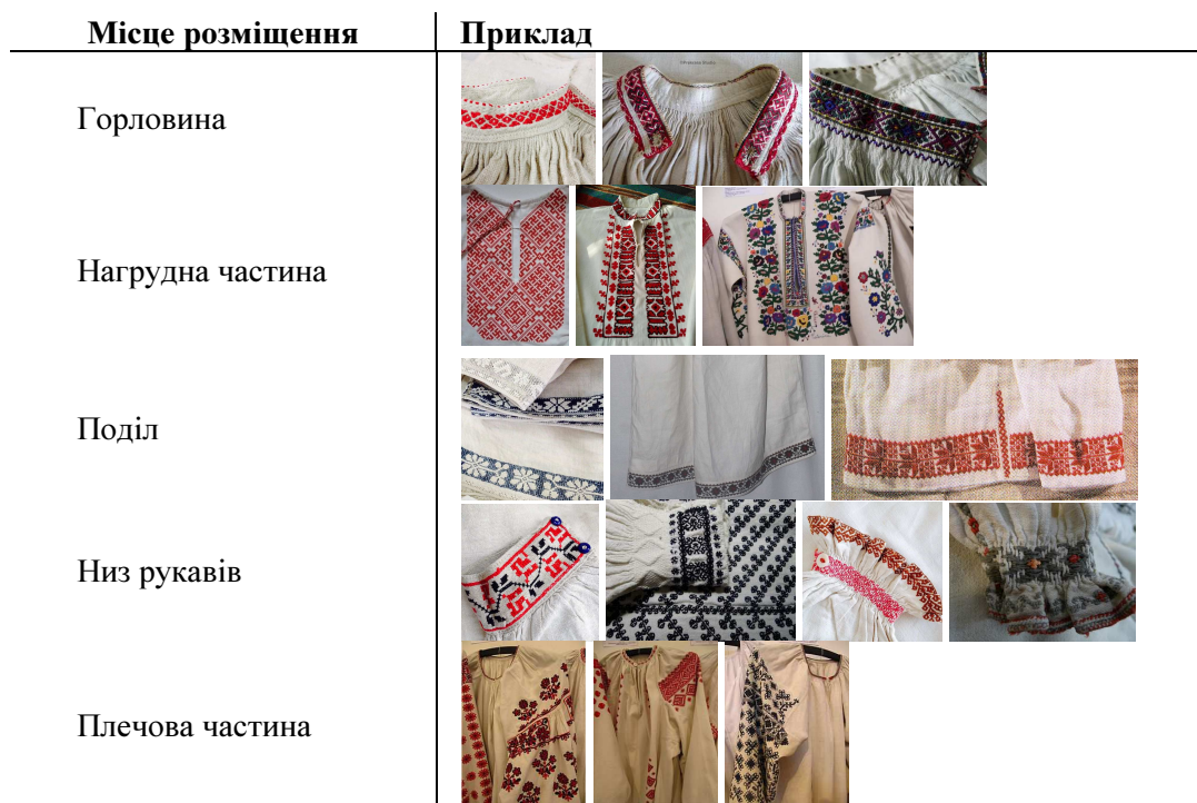
Таблиця 1. Варіанти розміщення орнаментів на сорочках

Підходи до інтерпретації національного костюма змінювалися: від механічного копіювання орнаментального декору до відтворення загальних принципів створення образу [8]. Яскравим прикладом звернення до національного одягу українців як творчого джерела став спільний проект Національного центру народної культури «Музей імені Івана Гончара» та молодої української дизайнерки Яни Червінської. Проект «Витоки» був покликаний вкотре розповісти про український національний костюм як про невичерпне джерело натхнення та ідей [9].