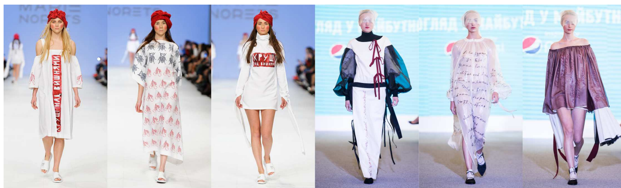
Рис 5. Показ моделей з розробленої колекції у фіналі конкурсів «EPSON DIGITAL FASHION» та «Погляд у майбутнє»

Висновки. Таким чином, проведені дослідження підтвердили актуальність поєднання художньо-композиційних характеристик українського національного костюма та технології сублимаційного друку на тканині для використання в процесі проектування сучасної колекції молодіжного жіночого одягу. Визначено потенційного споживача, доведено відповідність тематики творчого джерела психофізіологічним характеристикам обраної вікової групи. Результатами дослідження стало вивчення художньо-композиційних характеристик українського національного костюма з метою створення колекцій сучасного молодіжного одягу, а також отримання характеристик досліджуваного джерела для трансформування у принципи проектування одягу.