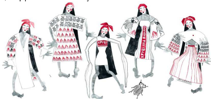
Рис 4. Пропозиції творчо-образного ескізного рішення обраного асортиментного блоку колекції, спроектованої за темою творчого джерела

На рис. 5 наведені фото моделей з різних асортиментних блоків колекції.