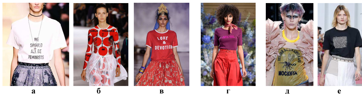
Рис. 2. Приклади використання текстового друку:

інтригують кількістю тексту: на їхніх футболках надруковані цілі опуси (рис.2) [10].