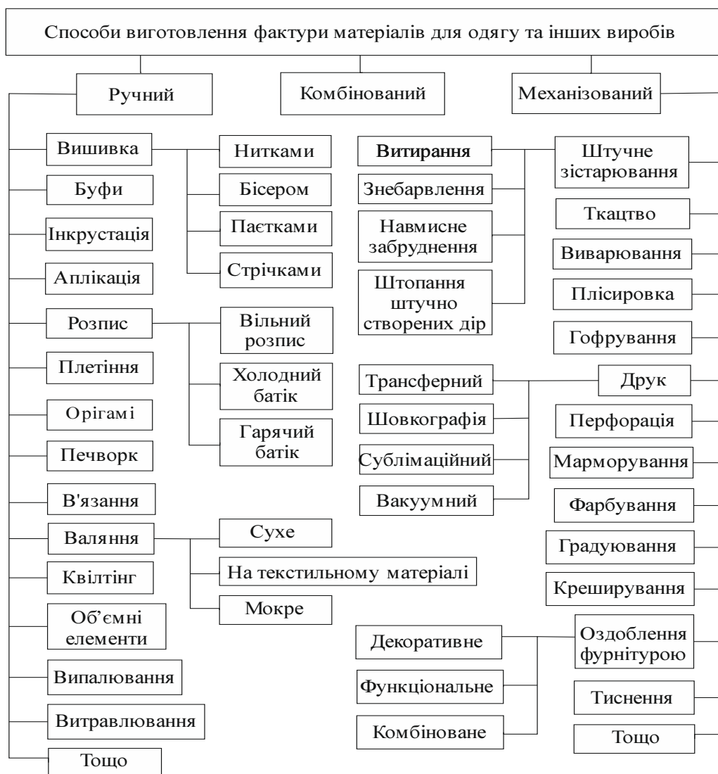
Рис. 2. Систематизація способів виробництва фактури матеріалів для одягу та інших виробів

Завдяки використанню сучасного обладнання урізноманітнюються техніки створення фактур механізованим (автоматизованим) способом, що також дозволяє значно скоротити час виконання роботи [7]. Серед фактурних ефектів, виготовлених на швейному та іншому обладнанні, найбільш розповсюдженими є ткацькі переплетення, штучне зістарювання