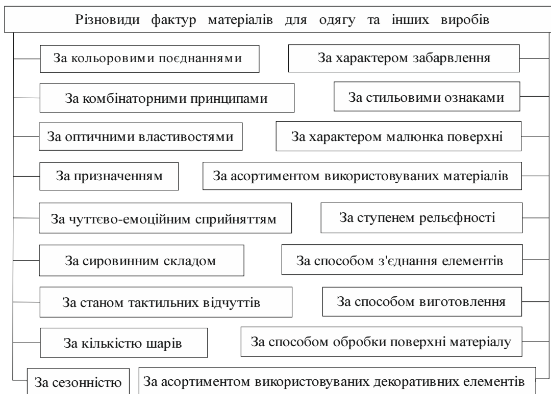
Рис. 1. Класифікація різновидів фактур матеріалів для одягу та інших виробів

Штучні фактури отримують шляхом технологічної обробки поверхні, у процесі якої відбувається зміна первинного матеріалу та надання йому нових візуально-пластичних якостей. Наприклад, застосування різноманітних способів обробки натуральної шкіри та хутра з метою покращення естетичних, ергономічних, функціональних тощо характеристик виробів з них.