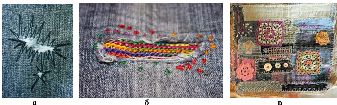
Рис. 6. Приклади застосування техніки штопання штучно створених дір:

а – нитками того ж кольору, що і тканина; б – контрастними нитками; в – з використанням накладних елементів [10]