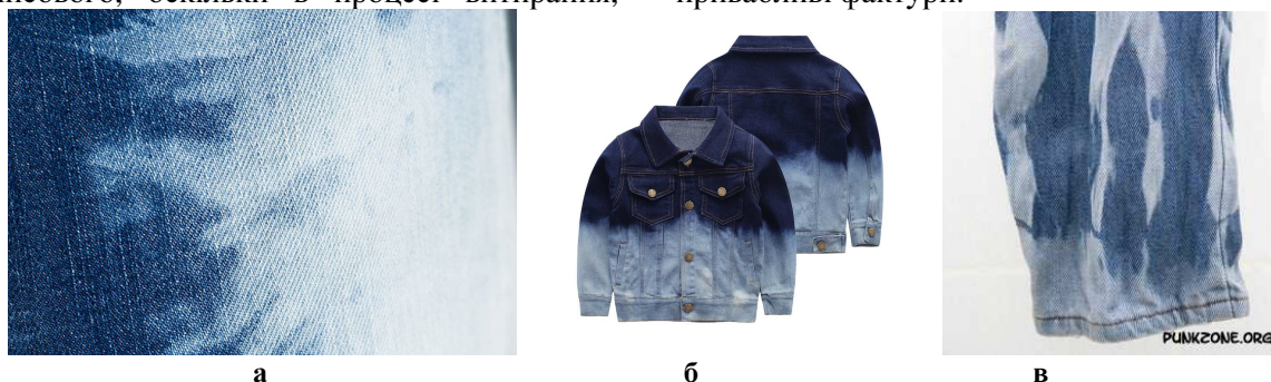
Рис. 5. Приклади застосування техніки знебарвлення джинсового одягу: а – хаотичними плямами; б – градієнтне; в – вертикальними смужками [7]

Окремим різновидом оздоблення є японська техніка штопання «боро» з використанням великої кількості дрібних елементів, як правило, різного матеріалу, що нашаровуються один на одного та з’єднуються різнокольоровими нитками. Такий спосіб дозволяє створювати оригінальні та естетично привабливі фактури.