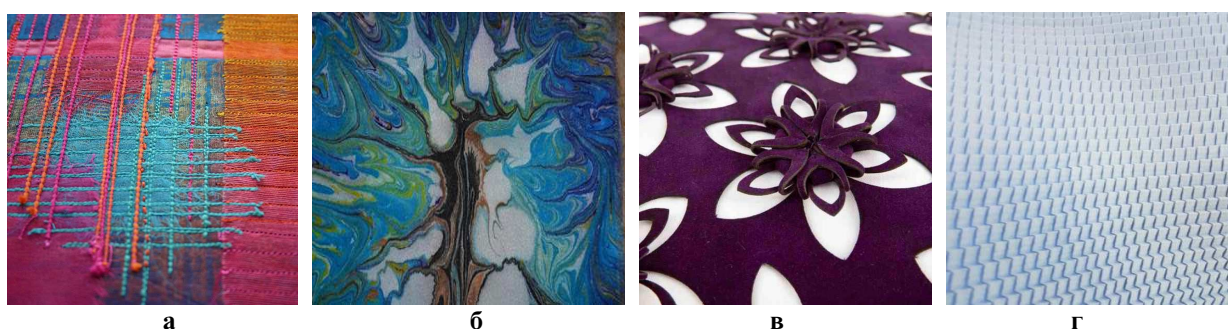
Рис. 4. Приклади фактур машинного способу виготовлення: а – ткацтво; б – мармурування; в – перфорація ; г – гофрування [9]

Поширеним є автоматизоване виготовлення фактурних ефектів для одягу, аксесуарів, іграшок та інших виробів. Але деякі способи створення фактур мають обмежений діапазон застосування. Наприклад, штучне зістарювання найчастіше використовують для виготовлення виробів декоративного призначення. Така техніка не застосовується для повсякденного одягу за виключенням джинсового, оскільки в процесі витирання,