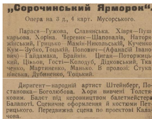
Рис. 8. 3 програми «Сорочинський ярмарок» Державної Української Опери. Тижневик «Нове мистецтво». № 1, 1925 р.