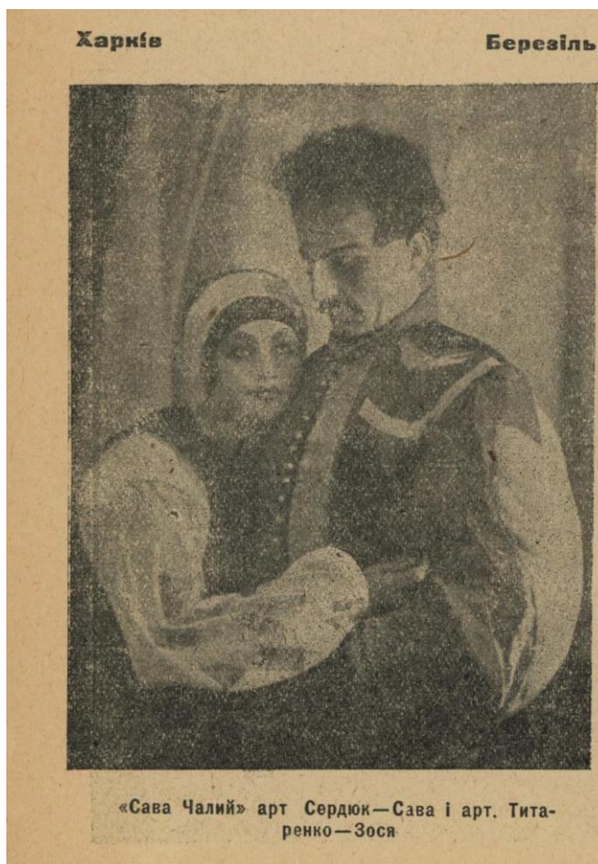
Рис. 4. Актори театру «Березіль» під час постановки трагедії «Сава Чалий» за І. Карпенко-Карим. Тижневик «Нове мистецтво». № 8, 1927 р.