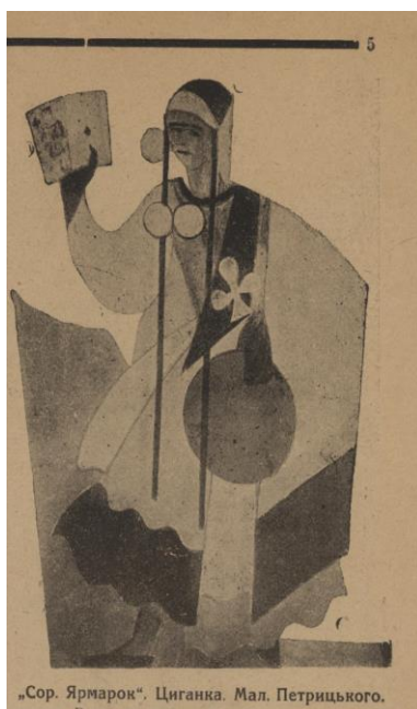
Рис. 12. А. Петрицький. Ескіз образу циганки до вистави «Сорочинський ярмарок». Тижневик «Нове мистецтво», №1. 1925 р.