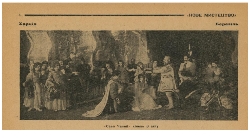
Рис. 5. Актори театру «Березіль» під час постановки трагедії «Сава Чалий» за В. Карпенко-Карим. Кінець 3 акту, сцена одруження головного героя Сави та Зосі. 3 тижневика «Нове мистецтво» № 8, 1927 р.