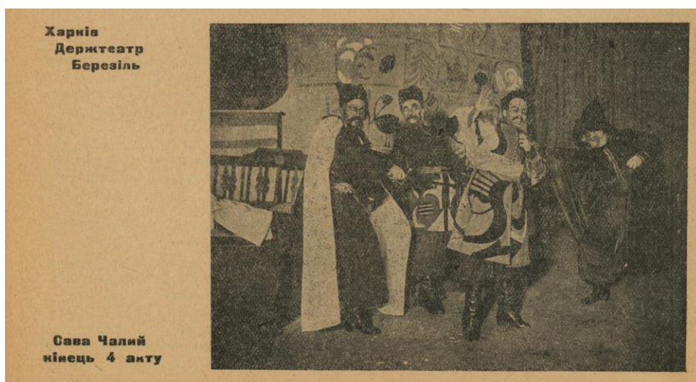
Рис. 6. Актори театру «Березіль» під час постановки трагедії «Сава Чалий» за В. Карпенко-Карим. Кінець 4 акту. Тижневик «Нове мистецтво» №8.1927 р.