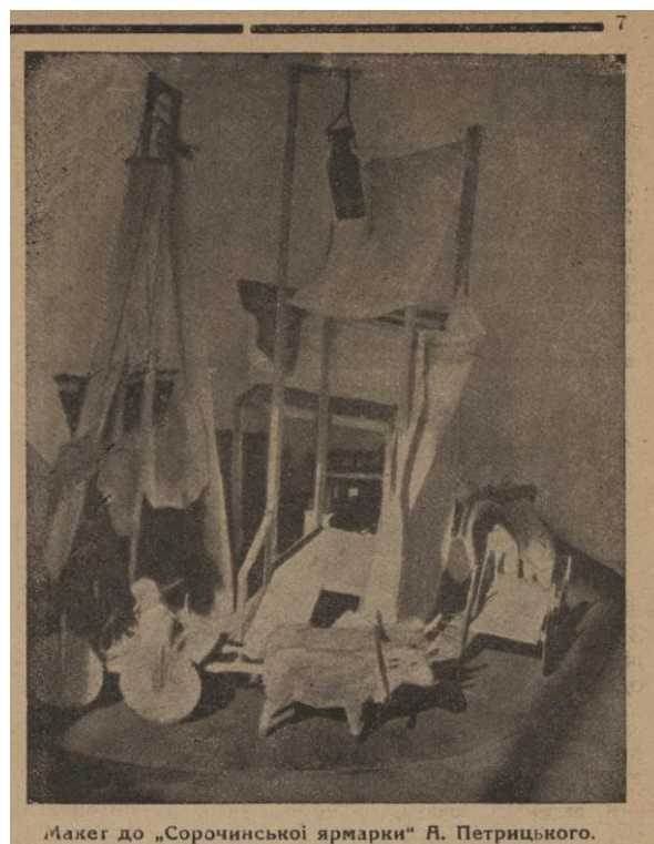
Рис. 10. А. Петрицький. Макет сцени «Сорочинський ярмарок». Державна Українська Опера. «Нове мистецтво», № 1, 1925 р.