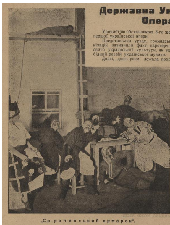
Рис. 9. Актори Державної Української Опери. «Сорочинський ярмарок». «Нове мистецтво», №1, 1925 р.