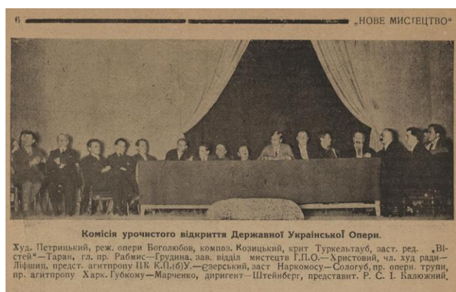
Рис. 7. Комісія урочистого відкриття Державної української опери. 3 жовтня 1925 р. Тижневик «Нове мистецтво». №1