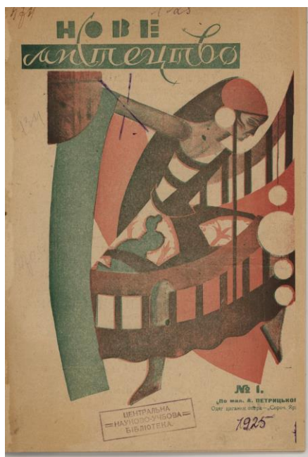
Рис. 11. А. Петрицький. Ескіз вбрання циганки до вистави «Сорочинський ярмарок». Обкладинка тижневика «Нове мистецтво», №1. 1925 р.