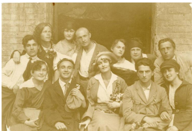
Рис. 1. Лесь Курбас разом з дружиною Валентиною Чистяковою (посередині перший ряд) і акторами театру Березіль Київ, 1919 р.