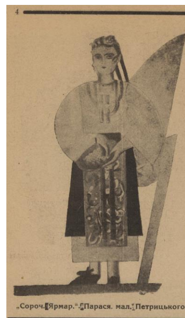
Рис. 13. А. Петрицький. Ескіз образу Парасі до вистави «Сорочинський ярмарок». Тижневик «Нове мистецтво» №1, 1925 р.