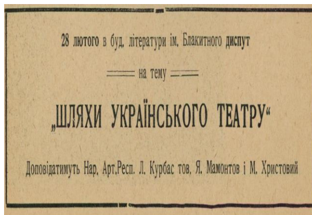
Рис. 2. Анонс з тижневика «Нове Мистецтво». № 8, 1927 р.