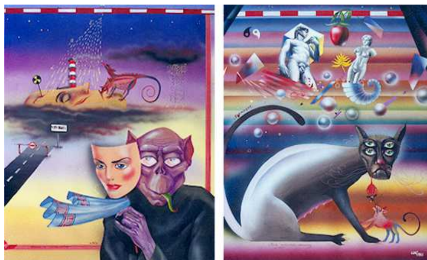
Рис. 2. Творчі роботи А.Г. Шаповала за напрямом – живопис на екологічну тему, диптих, присвячений трагедії на Чорнобильській АЕС, «Радіація», «Мутація», темпера, 1987 р.

Образи живопису художника-ілюстратора Шаповала А.Г. дуже наочні й переконливі, відрізняються специфікою технічного виконання і незвичайним рішенням художньо-образних завдань. Так, представлений диптих виконано з використанням ахроматичної колірної гами і присвячено трагедії на Чорнобильській АЕС (рис. 2).