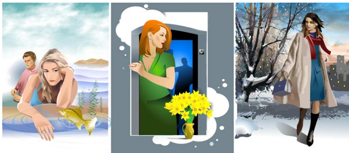
Рис. 5. Творчі роботи А.Г. Шаповала за напрямом – ілюстрації, комп'ютерна графіка, 2006 р.

Художнику також підвладний такий вид книжкової графіки, як ілюстрації (від лат. illustratio – освітлення, наочне зображення). У вузькому, точному значенні ілюстрації – це твори, призначені для сприйняття в певній