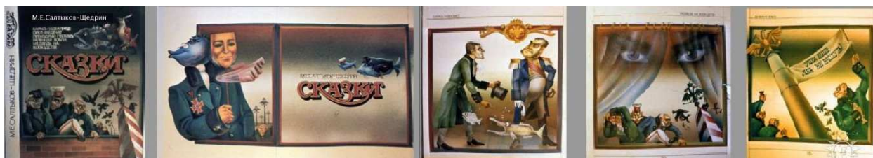
Рис. 7. Творчі роботи А.Г. Шаповала за напрямом – книжкова ілюстрація, 1989 р.

Характер ілюстраційної системи А.Г. Шаповала можна оцінювати з позицій передачі двох основних категорій дії – простору і часу. При розгляді індивідуальних особливостей образотворчої мови художника слід звертати увагу на те, як він веде лінію і пляму, характер руху, чому художник віддає перевагу, моделюючи форму, – лінії і пластиці або світлу і кольору, як буде просторові плани, як розподіляє чорне і біле, яке значення надає силуету, якими композиційними принципами переважно користується.