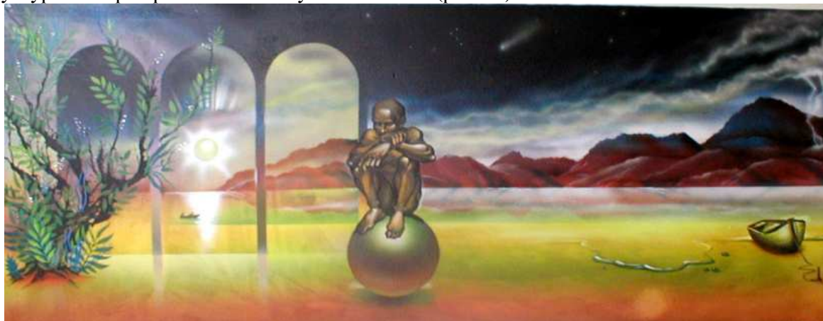
Рис. 10. Творча робота А.Г. Шаповала за напрямом – живопис, «Комета Хейла-Боппа», акрил, картон, 1997 р.

і холодним, веселим і сумним, спокійним і напруженим, світлим і темним. Колір є одним з важливих «інструментів» дизайнера, розуміння якого вражає, а також їх співвідношення, використання ахроматичної палітри при створенні автором власних робіт (рис. 10).