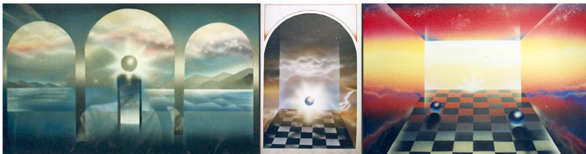
Рис. 4. Творчі роботи А.Г. Шаповала за напрямом – аерографія на екологічну тему, темпера, 2000 р.

Метафорично-стилізовані елементи авторських робіт життєвої або фантастичної теми доречно розмістити, наприклад, на палантинах, шарфах і хустках великих розмірів та інших виробах обраного асортименту.