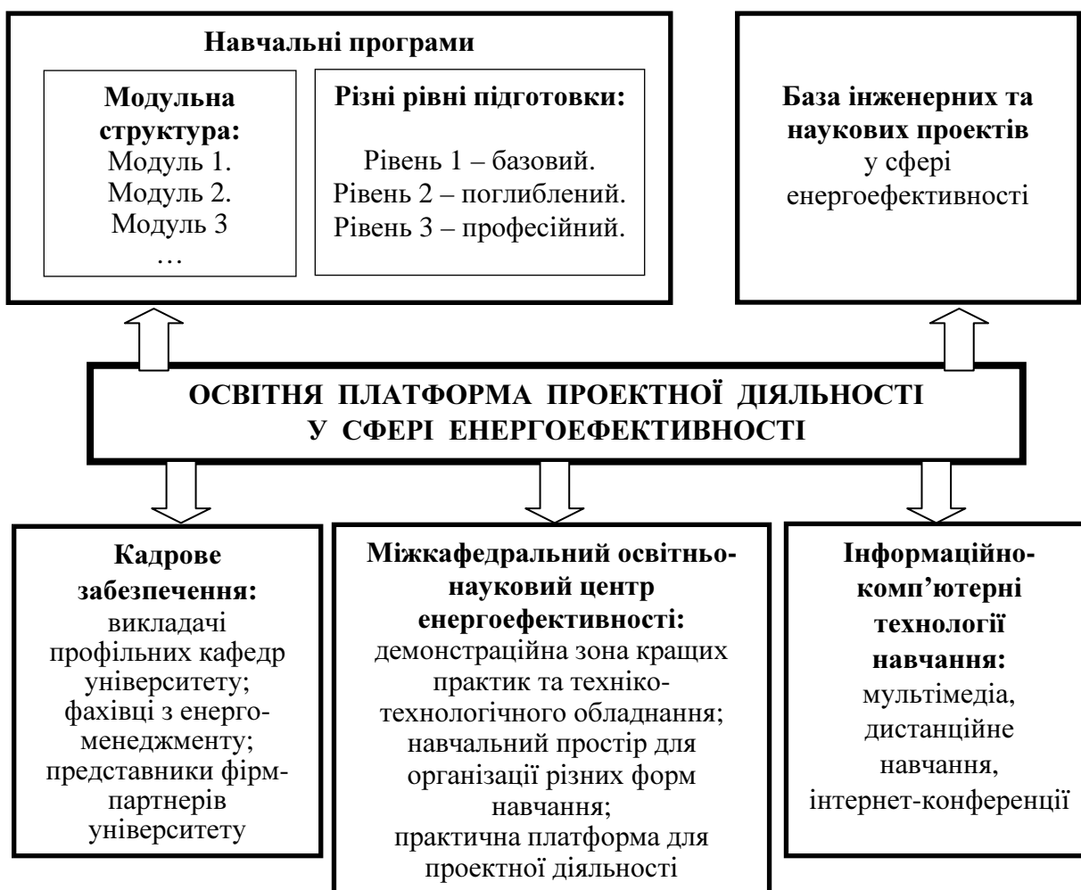
Рис.1. Концепція побудови освітньої платформи проектної діяльності у сфері енергоефективності

Результати дослідження. Для побудови інноваційної освітньої платформи проектної діяльності в сфері енергозбереження та енергоефективності пропонується концепція (рис. 1), яка являє собою систему загальних поглядів, необхідних для цілеспрямованого і оптимального вирішення поставленого завдання [10].