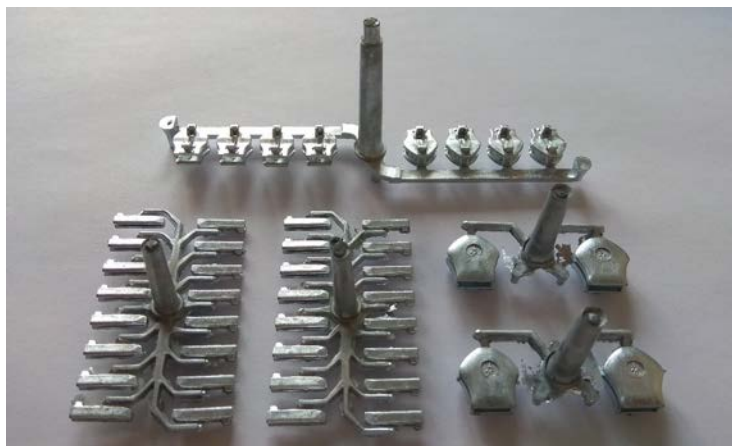
Рис. 1. Різні типи ливникових систем замка «блискавка»

Результати дослідження. Процес відділення металевих деталей від ливників відбувається при їх відносному переміщенні в середині робочої ємкості, що виконує складний просторовий рух. Ливникові системи, переміщаючись в середині ємкості, вдаряються об її стінки, внаслідок чого відбувається руйнування ливникової системи в тих місцях, де ливникова система утворює найменший поперечний переріз. В залежності від кутової швидкості ведучого валу машини в середині ємкості може реалізуватися каскадний, змішаний або водоспадний режими руху робочого масиву. На рис. 1 представлено різні типи ливникових систем замка «блискавка», які можуть оброблятися в ємкостях з різним характером руху.