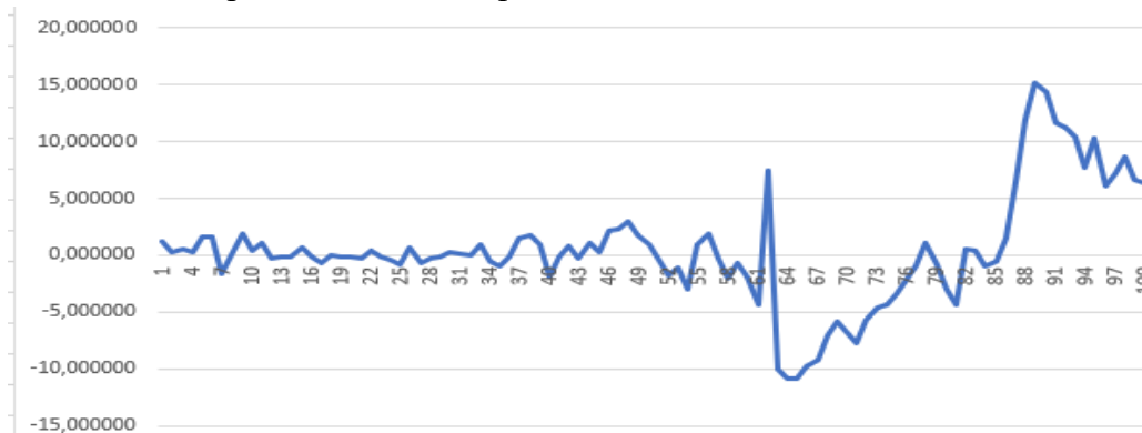
Рис.1. Графік гетероскедастичного процесу

Математичний опис динаміки дисперсії формально ґрунтується на рівняннях авторегресії та авторегресії з ковзним середнім. Подальше ускладнення таких моделей приводить до експоненційної узагальненої моделі авторегресії з умовною гетероскедастичністю. Для того щоб забезпечити скінченність значень умовної дисперсії, корені характеристичного рівняння моделі (для її авторегресійної складової) повинні знаходитися всередині кола одиничного радіуса.