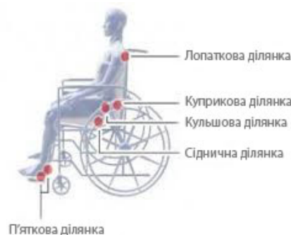
Рис.1. Ділянки тіла з ризиком виникнення пролежнів

Вступ. Пошкодження спинного мозку є однією з найбільш важких травм людського організму. Знерухомленість людини, яка значний час змушена проводити в інвалідному візку, породжує дуже багато супровідних ускладнень, які істотно погіршують результати реабілітації. Особливою небезпекою є можливість появи пролежнів [1], які формуються у тих місцях тіла, де кістки проходять близько до поверхні шкіри (Рис.1).