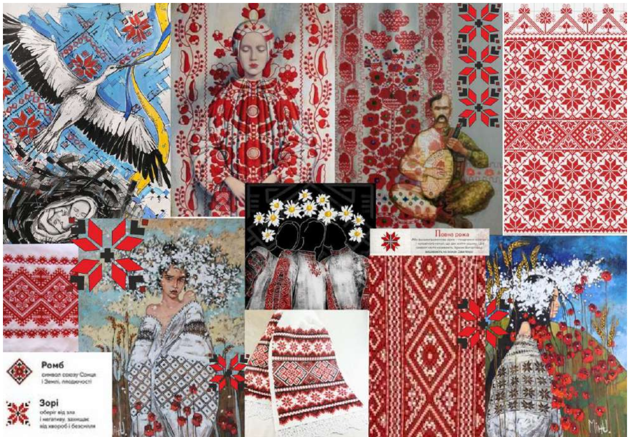
Рис. 2. MOOD BOARD «Український рушник»

Відомо, що творчий задум автора, на різних етапах, як проєктного так і виробничого процесу, найбільш доцільно представляють: пошуковий ескіз, фор-ескіз, творчий та технічний рисунок. Графічна манера та ступінь деталізації створюють особистий авторський стиль. На етапі ескізного проєктування відбувається остаточне наповнення форми, деталізація елементів та об'єднання окремих частин у цілісний структурний ансамбль одягу, взуття та аксесуарів.