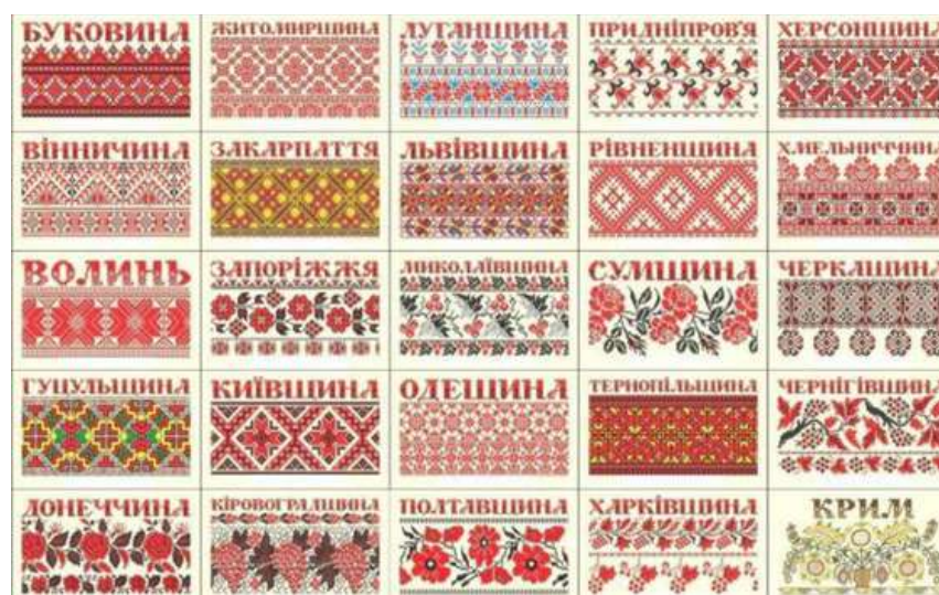
Рис. 1. Регіональна типізація крафтових національних візерунків [1]

української історії. У нашій країні вишитим рушникам завжди надавалося важливе образно-символічне значення. У візерунках відображаються культурна пам'ять народу, збережені давні магічні знаки, певний код та оберіг (образ «Дерева Життя»), кольорова символіка. Кожен регіон України може пишатися своїми унікальними вишитими рушниками, які відрізняються комбінуванням різних елементів, орнаментальних мотивів і візерунків, традиційних кольорів, технікою вишивання (рис. 1).