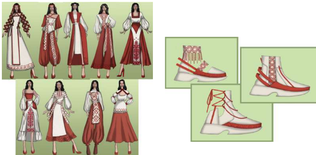
Рис. 4. Творча колекція «Український рушник»

трансформації орнаменту допомагають створити нові форми, текстури та образи. У цілому, використання національного орнаменту в дизайні творчої колекції жіночого одягу є дієвим засобом для створення