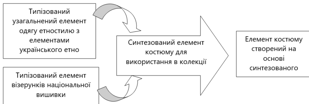
Рис. 4. Схематичне зображення творчого процесу отримання нових композиційних вирішень складових авторської колекції «Український рушник»

Творчий синтез нових дизайнерських рішень на основі типізованих елементів візерунків вишивки на українських рушниках Волинського регіону й типізованих рішень сучасного костюму дав змогу розробити ескізний ряд моделей одягу та взуття (рис. 4). Кожен образ колекції не лише відповідає творчому джерелу, а й тенденціям сучасної моди. Усі образи складається з прямокутних елементів, які відображають форми творчого джерела. А вишивка на рушнику – трансформується та прикрашає кожен образ. У всіх моделях є оздоблювальні елементи