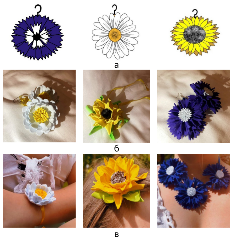
Рис. 5. Ескізи (а), готові вироби на моделях (б, в) колекції аксесуарів «Квітка надії»