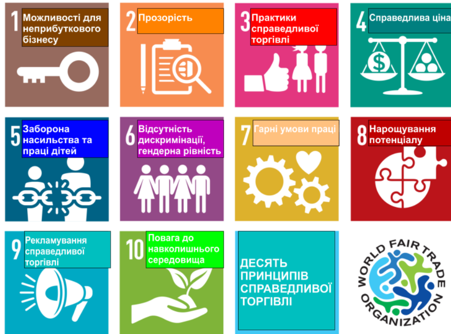
Рисунок 3 – Десять принципів справедливої торгівлі

Для цього в роботі проведено сегментування споживачів залежно від їх відношення до екології та екологічності, розглянуто основні мотиви споживання. Дослідження показують, що основним мотивом споживання екологічного одягу є турбота про здоров'я родини та власне здоров'я, трохи нижче в ієрархії знаходяться особливості еко-дизайну та турбота про стан навколишнього середовища. Саме ці мотиви необхідно використовувати при формуванні маркетингової політики у сфері еко-