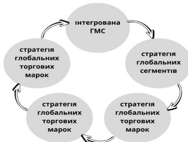
Рис. 4. Глобальні маркетингові стратегії